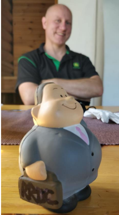
Tero ja RRDC-ukkel.