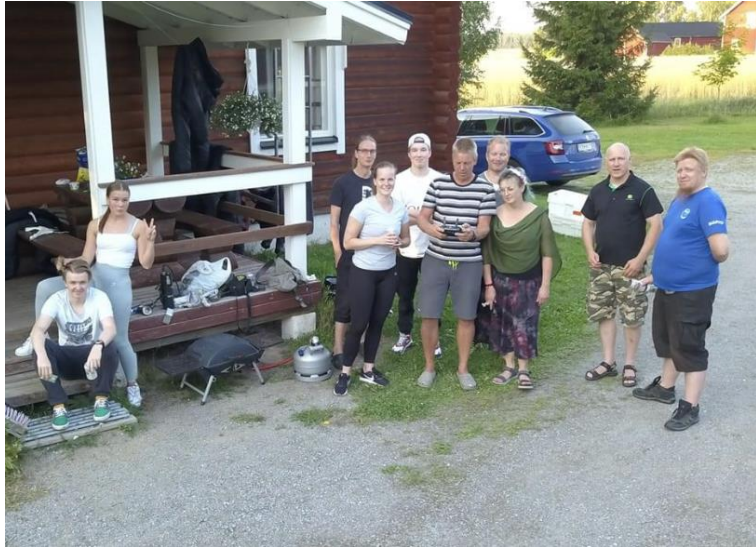
Ryhmäkuva dronella otettuna.