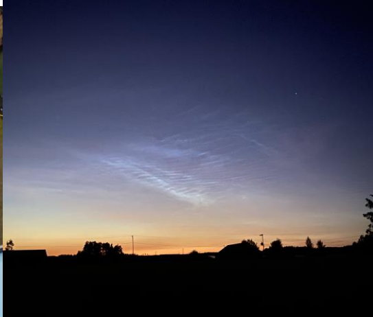
perjantai illan maisemia.